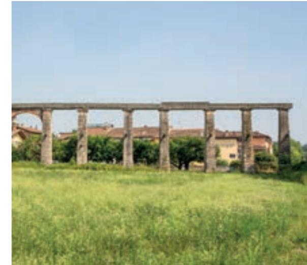
Canale irrigazione (Settimo)

Più avanti si giunge presso la corte Colombina situata a breve distanza dal fiume (14) e continuando si arriva alla località Nassar, sede un tempo di un hospitale per viandanti che conserva edifici antichi con interessanti elementi architettonici, come il vecchio mulino oggi complesso abitativo. La strada alzaia continua verso Parona per poi raggiungere Verona.