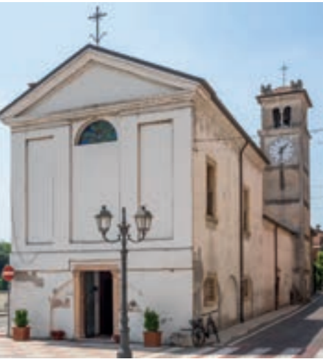
Chiesa di San Rocco

Gli itinerari proposti nascono dall'intento di dare risalto all'ambiente fluviale e agli elementi che lo contraddistinguono, legati alla storia, alla natura, all'arte e alle tradizioni di questo territorio. I percorsi da fare a piedi o in mountain-bike si snodano su sentieri e carrarecce sulla riva sinistra dell'Adige, dove il paesaggio mostra molteplici fisionomie e nei tratti lontani dalle abitazioni mantiene gli equilibri ecologici originari. Fino alla seconda metà dell'Ottocento Pescantina, che nasce e si allunga su questa riva, il cui nome deriva da "pescante", cioè luogo che pesca nell'acqua, a sottolineare lo stretto legame da sempre esistente tra il paese e il suo fiume, era un cardine della navigazione fluviale. Barche di vario tipo solcavano le acque nei due sensi e per risalire il fiume era necessario trainarle con animali lungo la strada che costeggiava l'Adige, dalla foce fin quasi a Bolzano. Tale strada, detta "del tiraglio" o alzaia, seguiva le anse del fiume assecondando la forma della riva. Oggi restano molteplici tracce di queste antiche attività, spesso circondate dalla splendida flora selvatica che regala incantevoli colori e profumi avvolgenti.