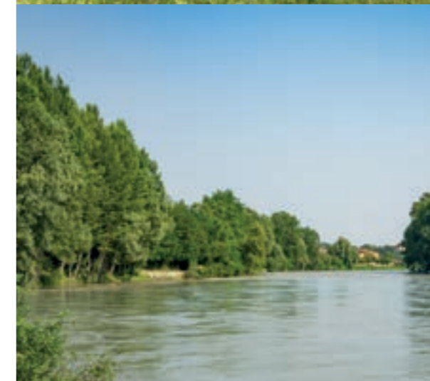
Scorcio paesaggistico (Settimo)