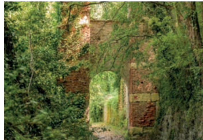
Resti di impianti idrovori

dei barcaioi e degli animali da traino, che riporta uno stemma dei Salvi, proprietari di questi edifici nel Settecento. Al civico 10 sulle pareti restano tracce di un'immagine sacra del 500 e presso la riva rimangono resti significativi del piccolo molo che rendeva l'attracco più sicuro alle imbarcazioni. Il sentiero prosegue snodandosi tra il fiume e il muro di cinta di un vasto terreno agricolo fino al ponte che collega il paese di Arcé (4) con la sponda destra del fiume. Qui sulla destra si notano due delle torrette che delimitano il parco di villa Albertini-da Sacco (5).