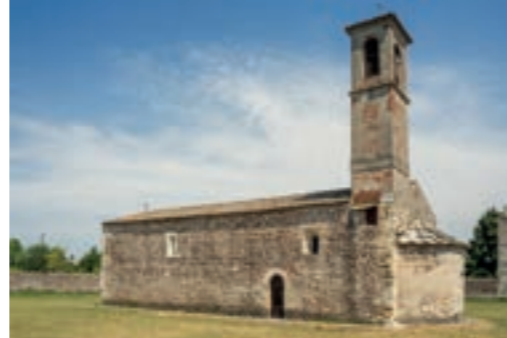
Chiesa San Michele Arcangelo